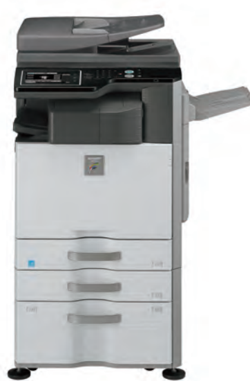
Unità Base Vassoio uscita superiore Finisher interno Stand con 1 cassette da 500 fogli + 1 cassetto da 2.000 fogli