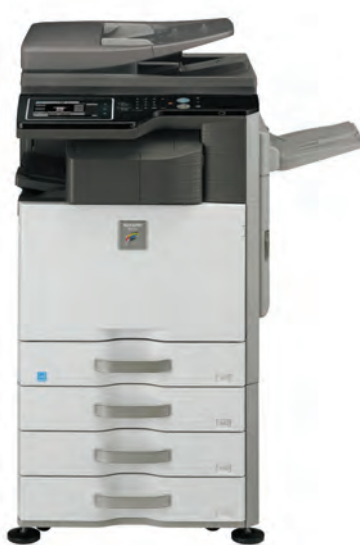
Unità Base Vassoio uscita superiore Finisher interno Stand con 3 cassette da 500 fogli