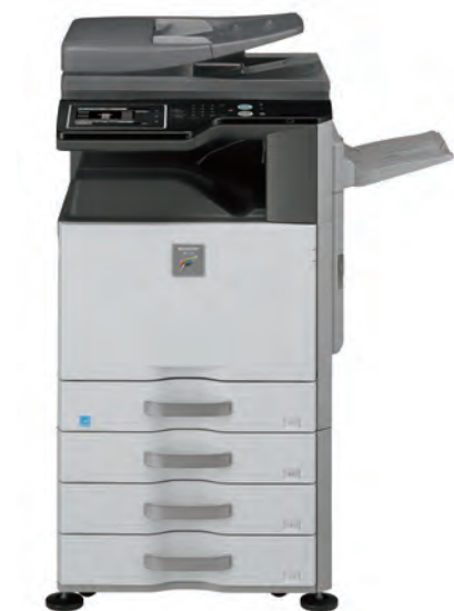
Unità Base Vassoio uscita superiore Stand con 3 cassette da 500 fogli